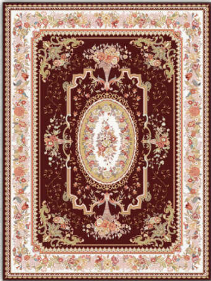
فرگل زرشکی - Fargol d. red