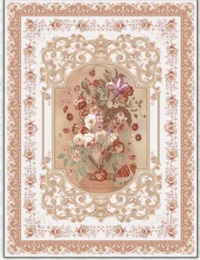
هنر - Honor

مشیت رنگ - بافت ویژه اینکورد پر اینتد - تراکم بالای انحصاری 8 colors - incorporated weaving high technology