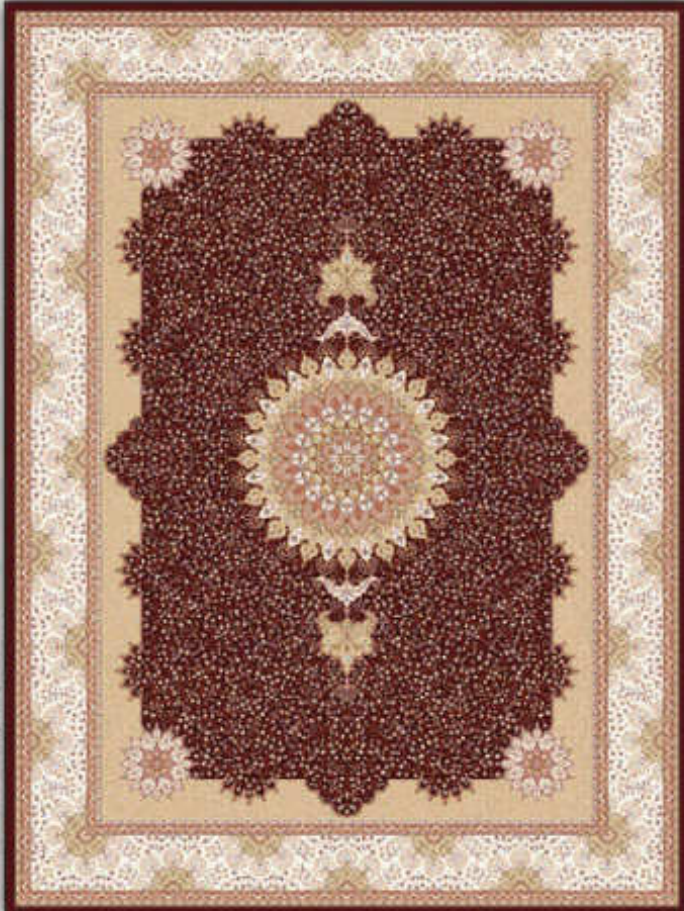
گلریز - Golriz

21 colors - 500000 knots per square meter