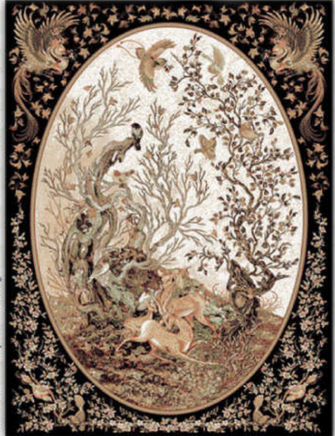
غزل - Ghazal