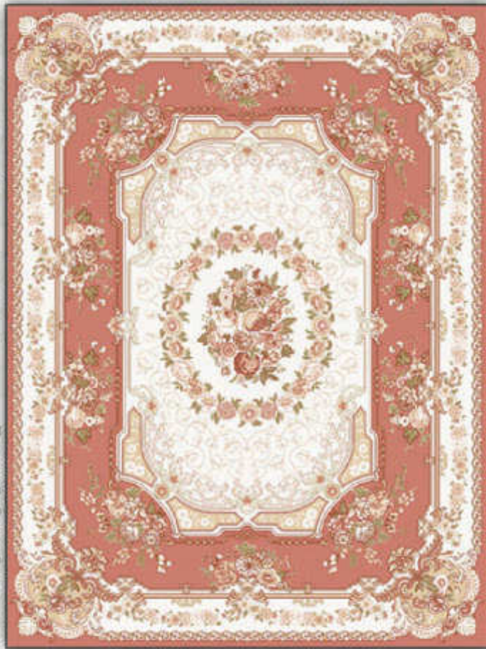
هستی - Hasti

شش رنگ ریز بافت (الوتینگ) پانصد شانه تراکم هزار واقعی