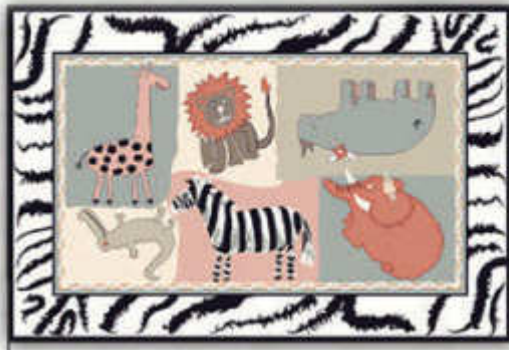
دامبو - Dambo