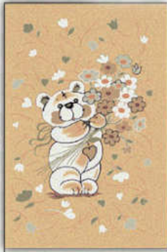
چاخالو - Chaghaloo