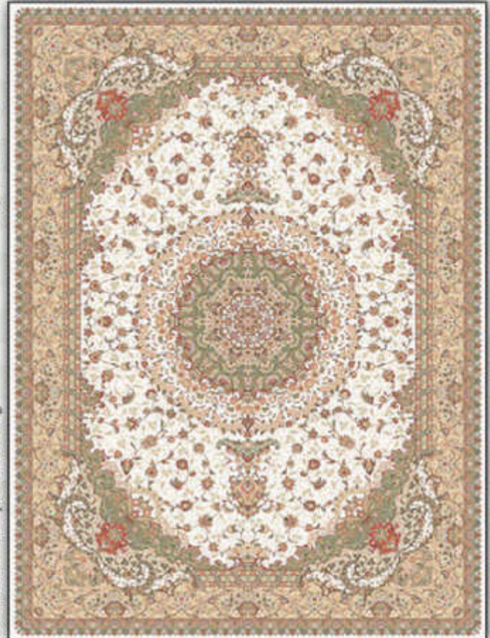
پارسیس - Parsis