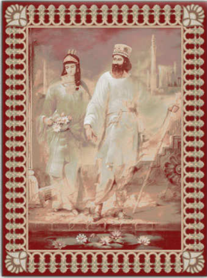
تخت جمشید - Takhte jamshid

مشک رنگ - بافت ویژه اینکورپرایتد - تراکم بالای الحصارى 8 colors - Incorporated weaving high technology