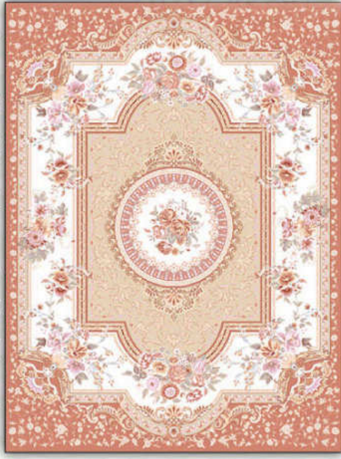
رویال - Royal

مشیت رنگ - بافت ویژه اینکورد پر اینتد - تراکم بالای انحصاری 8 colors - incorporated weaving high technology