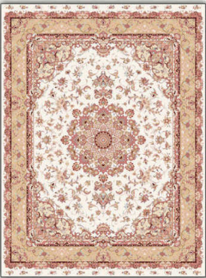
مجلسی - Majlesi