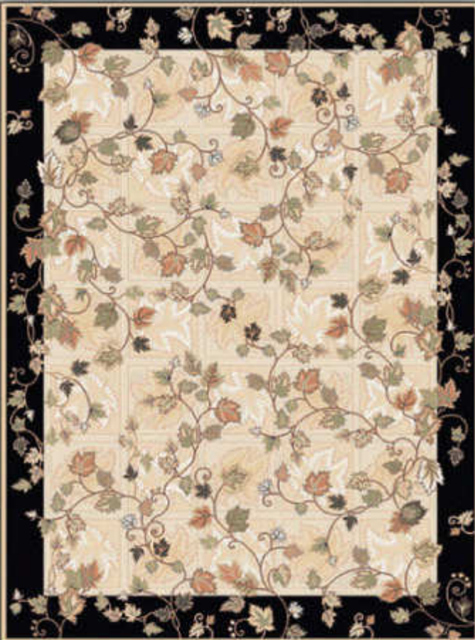
ایتالیا - Italia