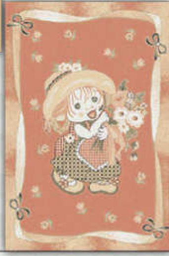
نی نی - Nini