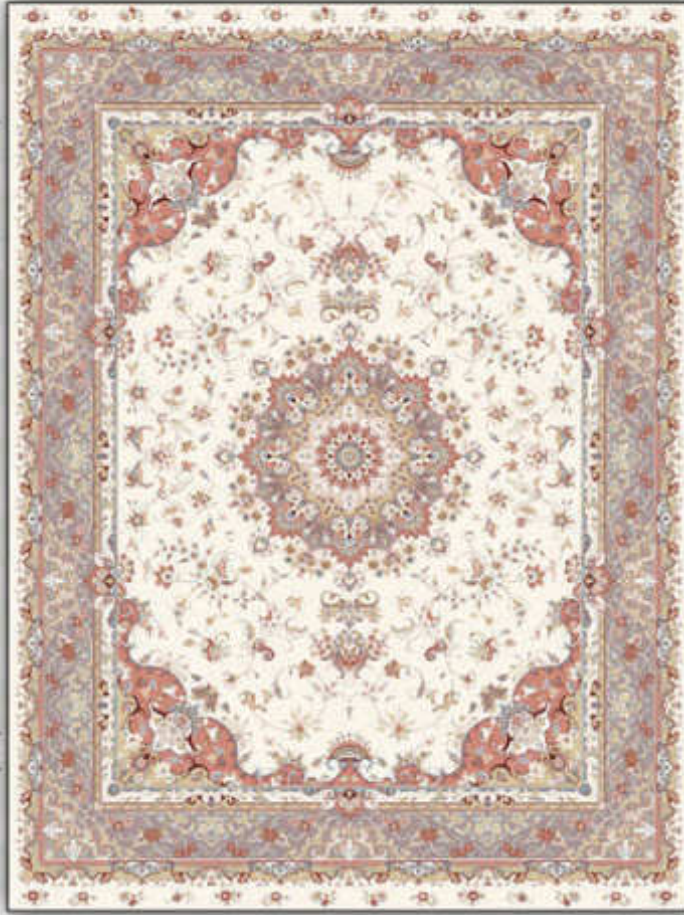
ارژنگ کرم - Arjhang creme