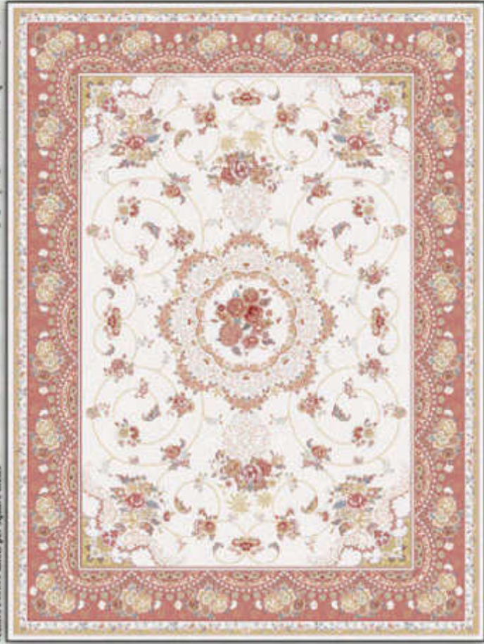
والا - Vala