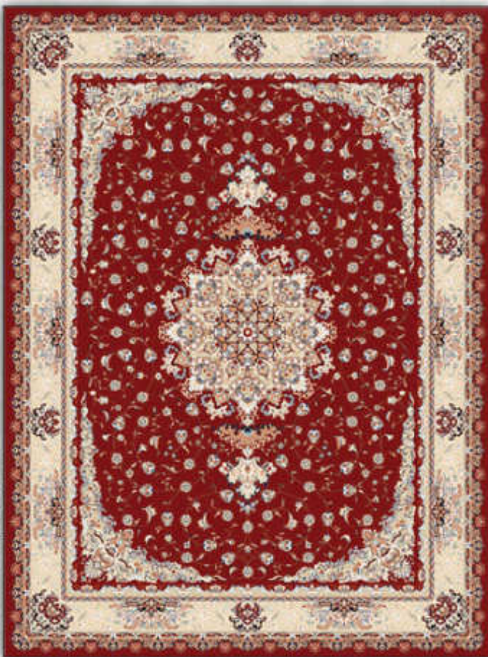
نیمایاکی - Nima d.red

7 colors - 500000 knots per square meter