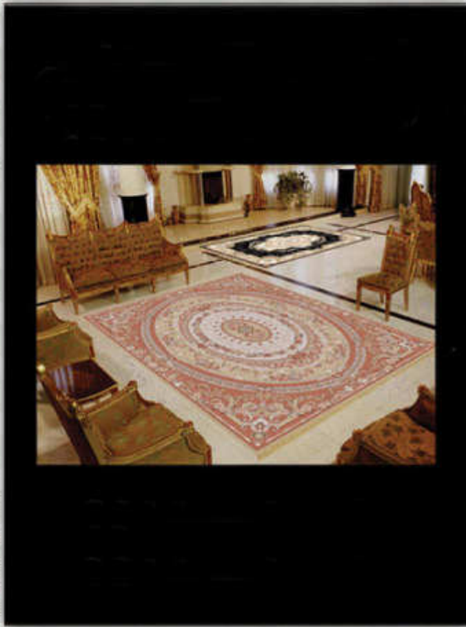
باصفا شانه گره در گير شش رنگ