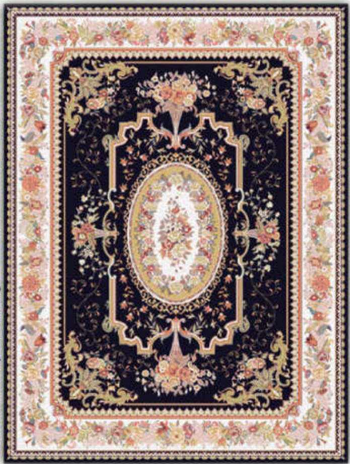
فرگل سرمه ای - Fargol d. blue