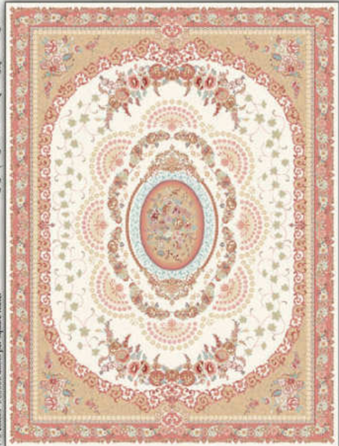
سنا - Sana

4-3 colors - 500000 knots per square meter