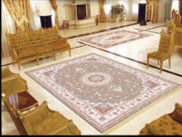
مشک رنگ - بافت ویژه اینکورپر ایتد - تراکم بالای انحصاری

8 colors - Incorporated weaving high technology