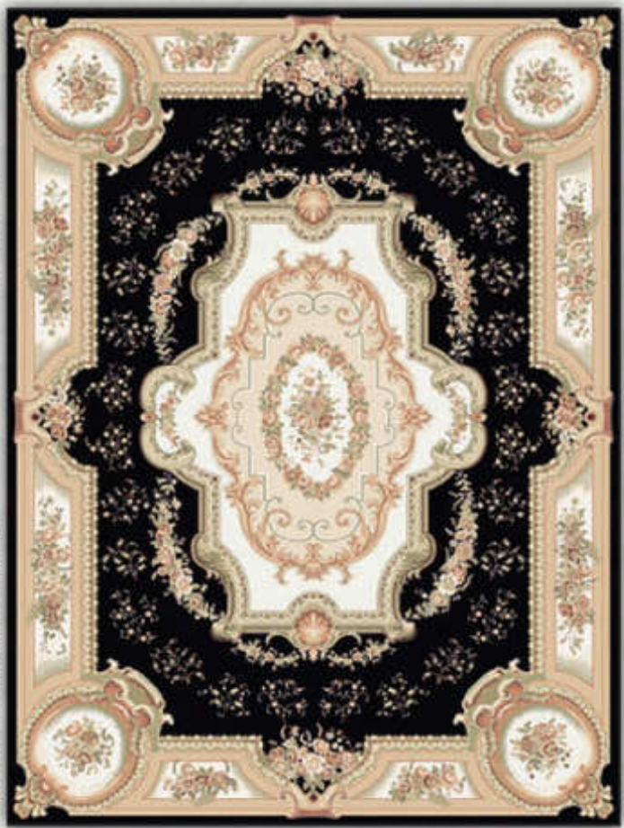
سدف - Sodaf