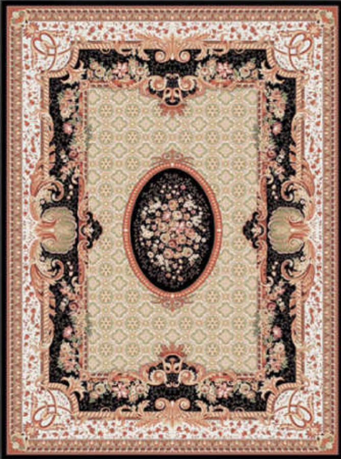
بهار - Bahar