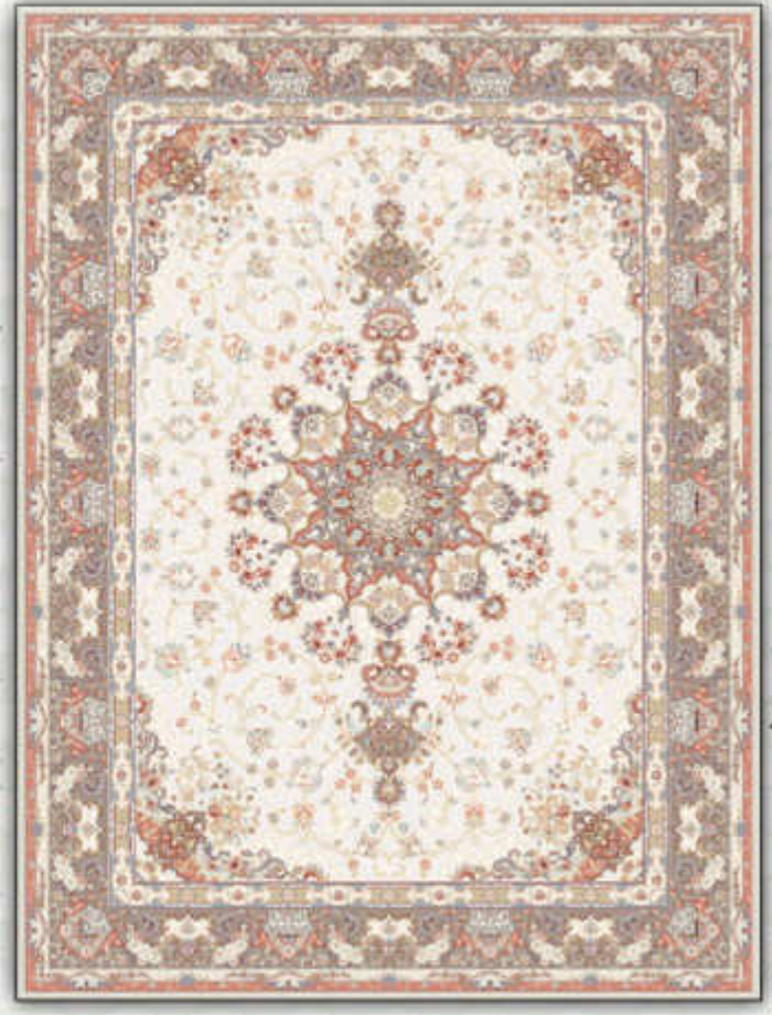
امپراطور - Emrator

مشیت رنگ - بافت ویژه اینکورد پر اینتد - تراکم بالای انحصاری 8 colors - incorporated weaving high technology