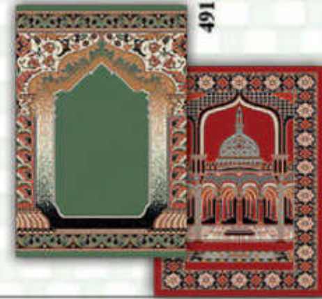
5 COLORS - Incorporated weaving