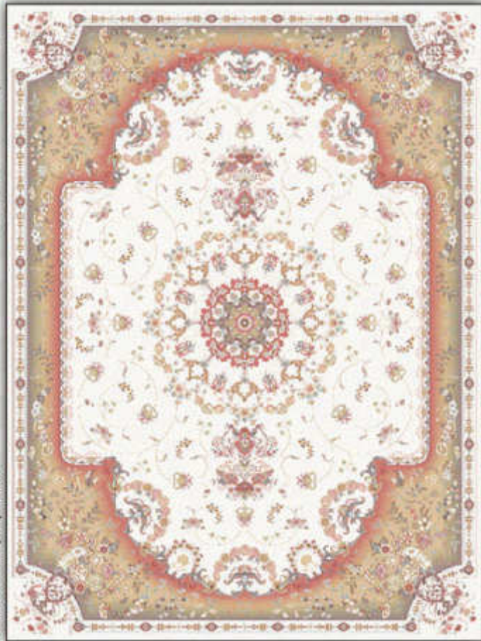
مروارید - Morvarid