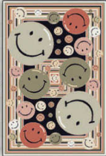
قلقلی - Ghelgheli