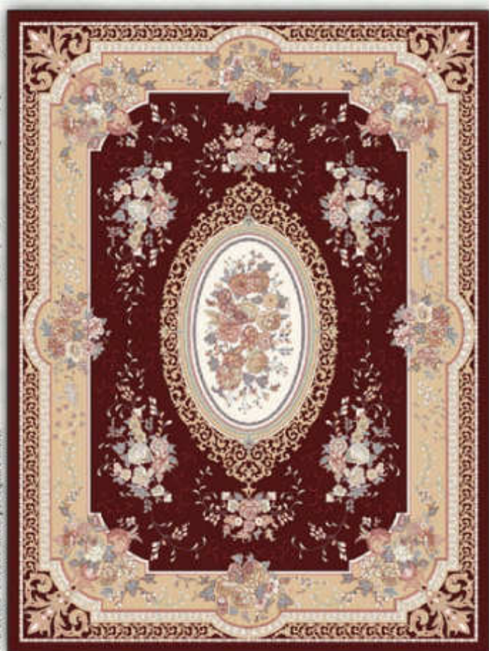
انار - Anar

4-3 colors - 500000 knots per square meter