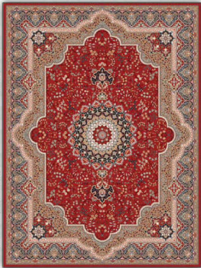
شهبستان - Shabestan