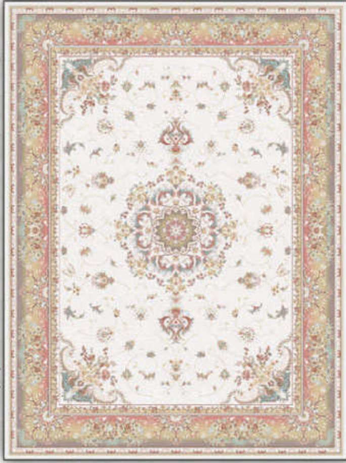
نازگل - Nazgol