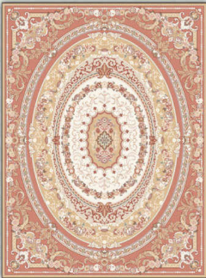
حديث - حدیث