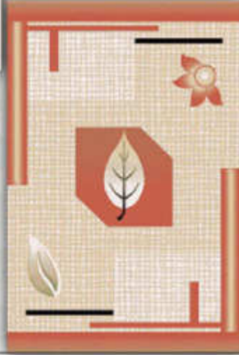
افتابگردان - Aftabgardan