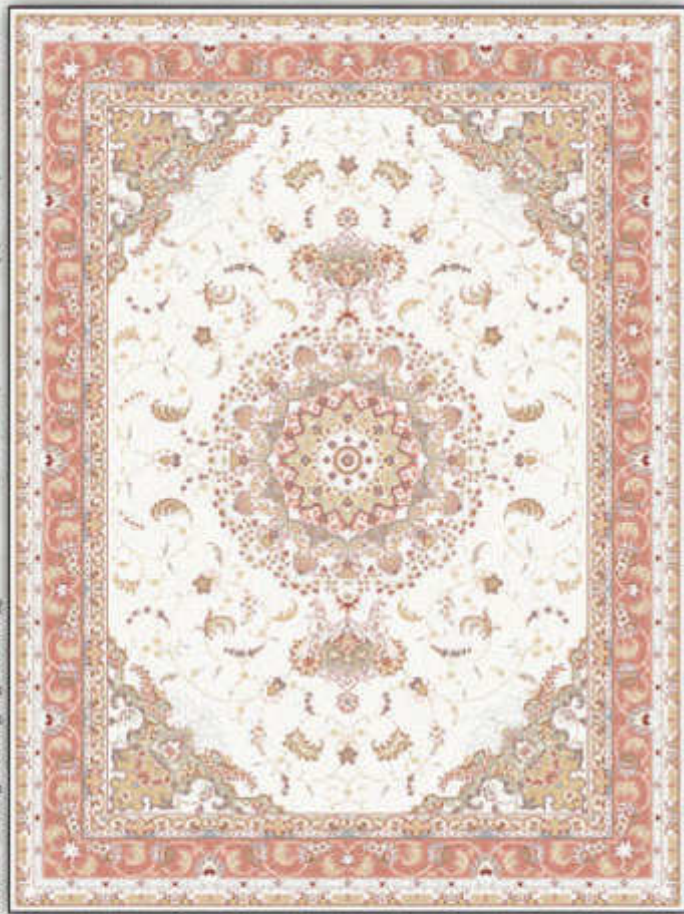
ایدین - Aidin

شش رنگ ریز بافت (الوتینگ) پانصد شانه تراکم هزار واقعی