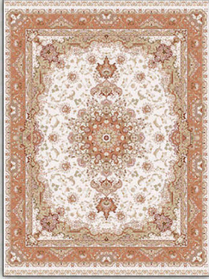
بهشت - Behesht

مشیت رنگ - بافت ویژه اینکورد پر اینتد - تراکم بالای انحصاری 8 colors - incorporated weaving high technology