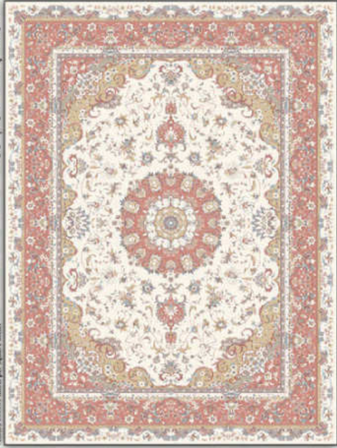
الناز - Elnaz